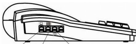
Роз'єм для підключення комп'ютера та модема Роз'єм для підключення сканера штрих-коду Роз'єм для підключення ваг

1. Проверить соединение РРО и модема интерфейсным кабелем. ( Внимание!!! Категорически запрещается отключать и подключать интерфейсный кабель при включенном РРО или модеме ).