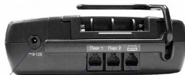
Роз'єм для підключення блока живлення Роз'єм для підключення ПК та модему Роз'єм для підключення ваг та сканера Роз'єм для підключення грошової скриньки (опційно)